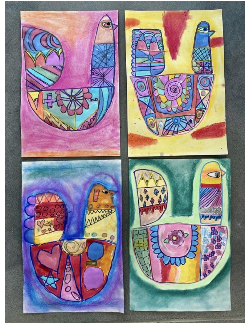
Parengē dailēs mokytoja Žaneta Puodžiūnienė