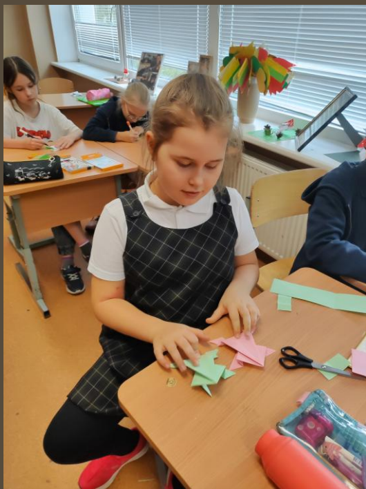
Išmoksta lankstyti varlę